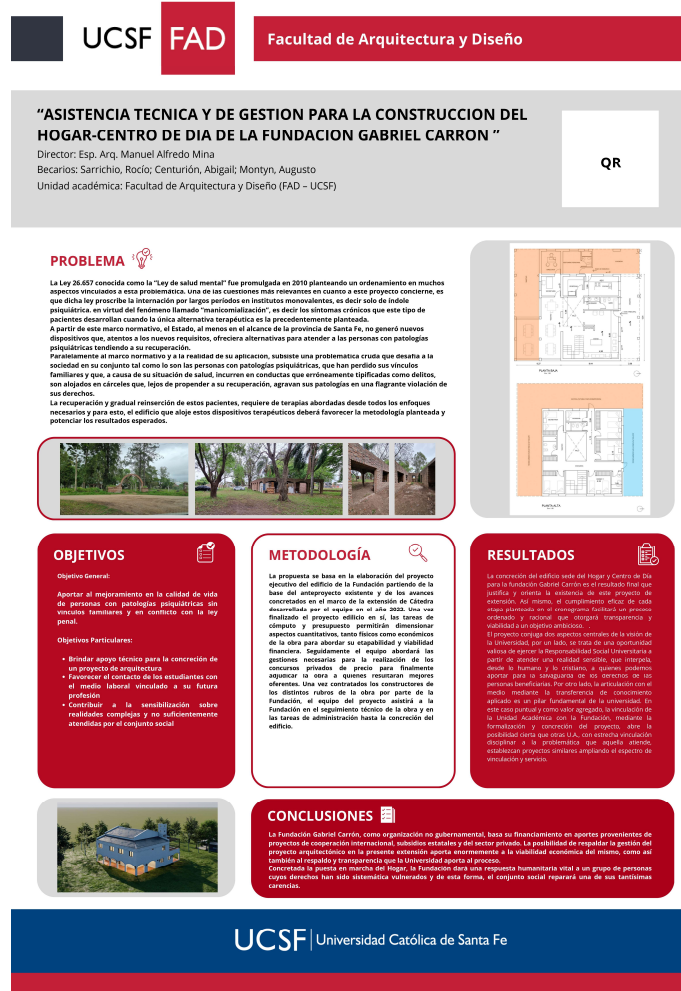
Poster del proyecto en el EIE – Imagen del equipo

El proyecto y los avances fueron presentados al Encuentro de Investigadores y extensionistas de la Universidad Católica de Santa Fe para lo cual se elaboró el poster correspondiente y el video explicativo de los alcances del proyecto. Por tratarse de una muestra itinerante, el proyecto presentado al EIE recorrerá, además de la Sede Santa Fe, las otras sedes de la Universidad lo que permitirá una importante difusión del mismo.