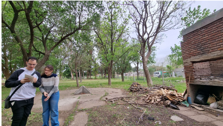
Becarios trabajando en relevamiento de la residencia provisorio

Así mismo, la dinámica de funcionamiento de la Fundación implicó la realización por parte del equipo de una auditoría edilicia y posterior informe del cumplimiento de las normas para edificios de residencia de personas con discapacidad en el marco de las Resoluciones 1052 del ministerio de Salud de la Provincia de Santa Fe y 1328 del Ministerio de Salud de la Nación por parte de la vivienda actualmente utilizada como residencia. El informe elaborado sirvió de base para la planificación de acciones de adecuación a la norma para la solicitud de la habilitación como residencia del edificio provisorio.