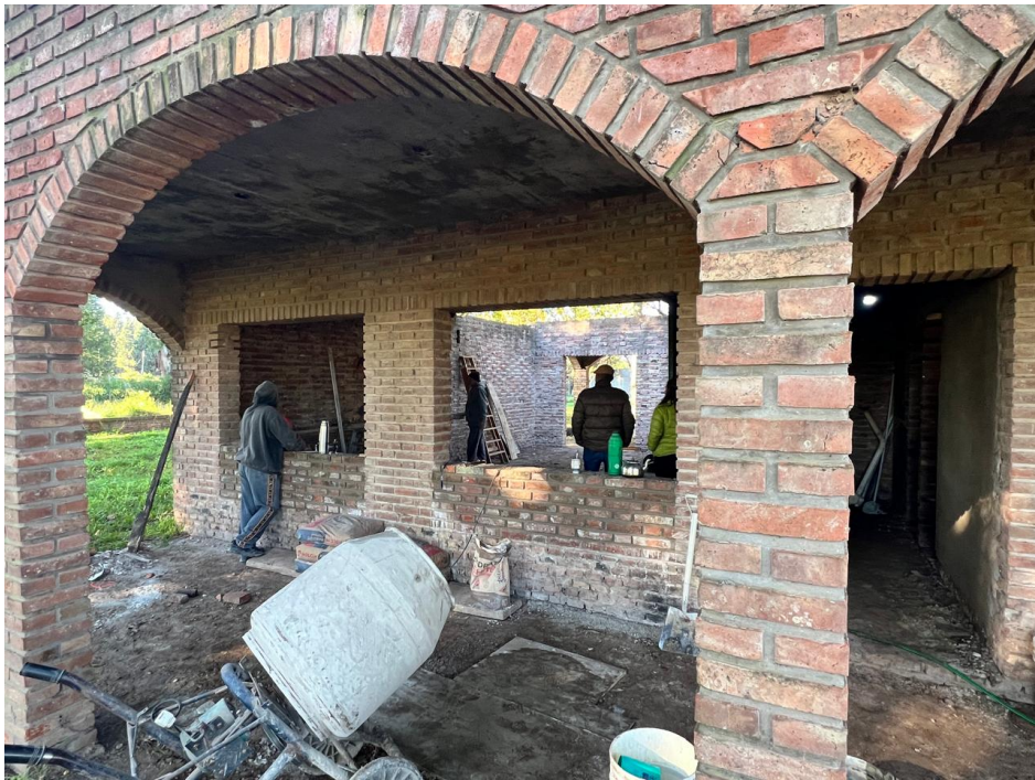
Imágenes del seguimiento de Obra – Fotos del equipo