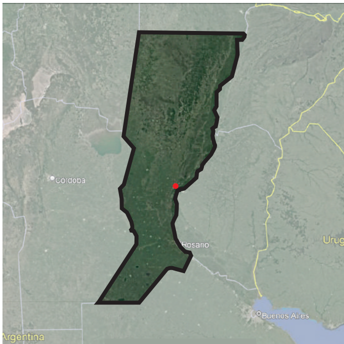
Santa Fe, Argentina