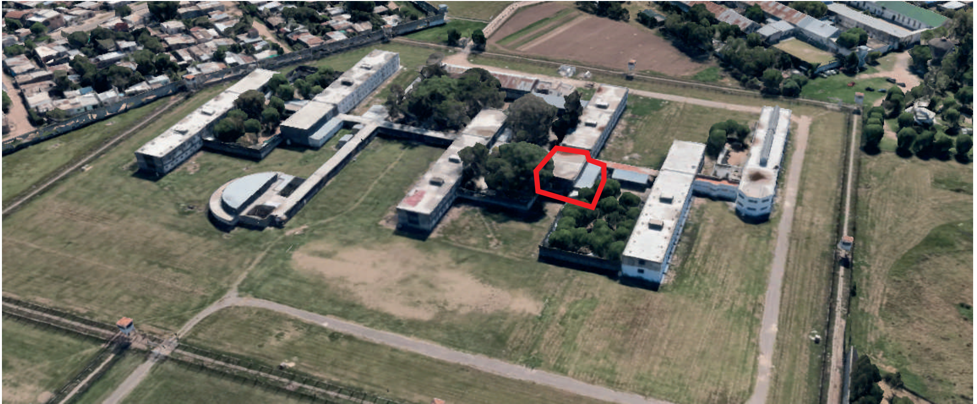
Ex área médica

UCSF - Facultad de Arquitectura Sede Santa Fe