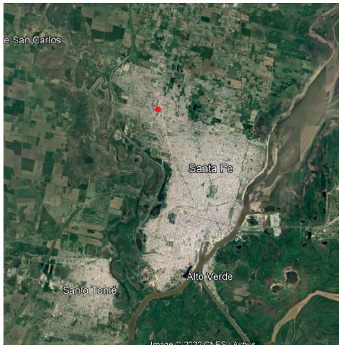
Santa Fe Capital