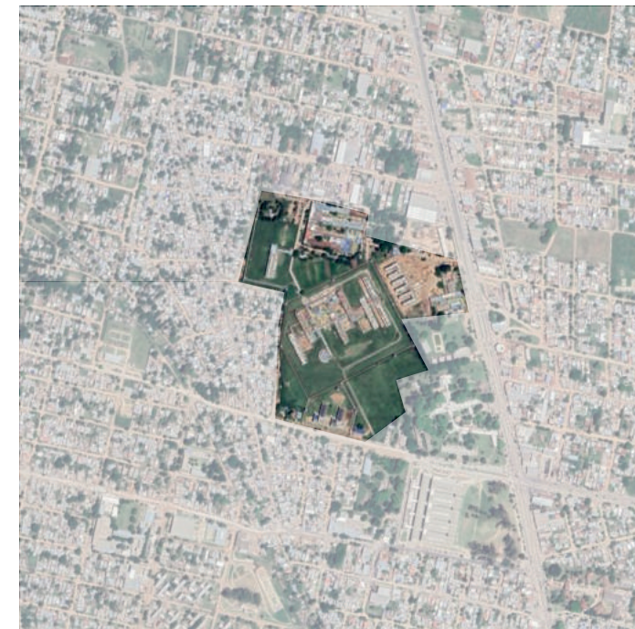
Carcel de Las Flores